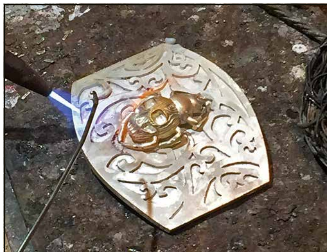
Le scarabée est l'emblème des bijoux Scaro